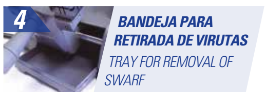
4 BANDEJA PARA RETIRADA DE VIRUTAS TRAY FOR REMOVAL OF SWARF