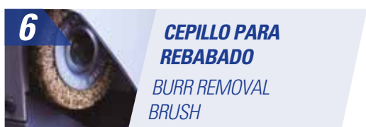
6 CEPILLO PARA REBABADO BURR REMOVAL BRUSH