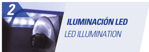
2 ILUMINACIÓN LED LED ILLUMINATION