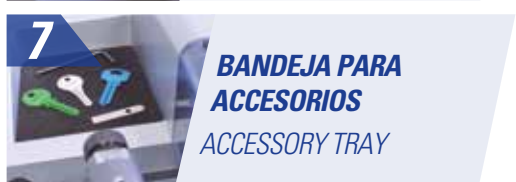
7 BANDEJA PARA ACCESORIOS ACCESSORY TRAY