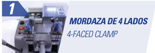
1 MORDAZA DE 4 LADOS 4-FACED CLAMP

BERNA is the new compact professional model of duplicating machine that combines simplicity and versatility. The last generation techniques and materials make it a resistant and precise duplicating machine.