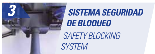
3 SISTEMA SEGURIDAD DE BLOQUEO SAFETY BLOCKING SYSTEM