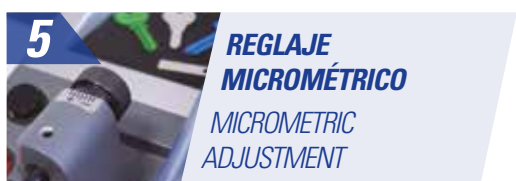
5 REGLAJE MICROMÉTRICO MICROMETRIC ADJUSTMENT