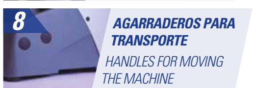
8 AGARRADEROS PARA TRANSPORTE HANDLES FOR MOVING THE MACHINE